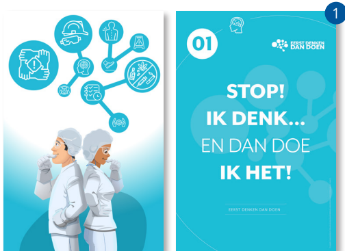
EERST DENKEN DAN DOEN