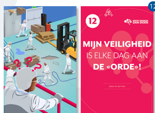
ORDE EN NETHEID