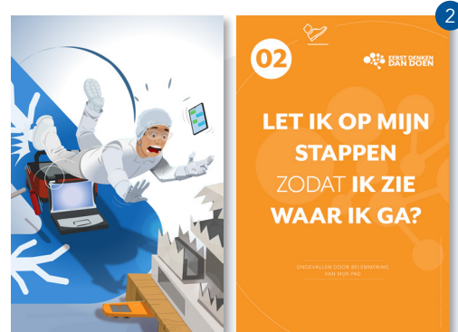
ONGEVALLLEN DOOR BELEMMERING VAN MIJN PAD