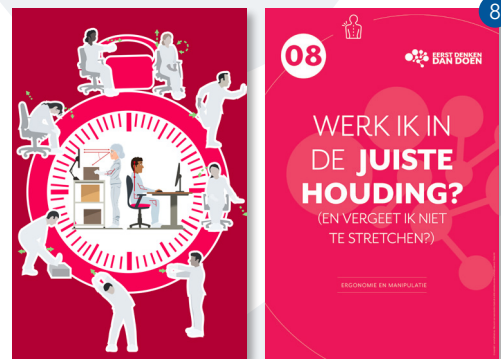
ERGONOMIE EN MANIPULATIE