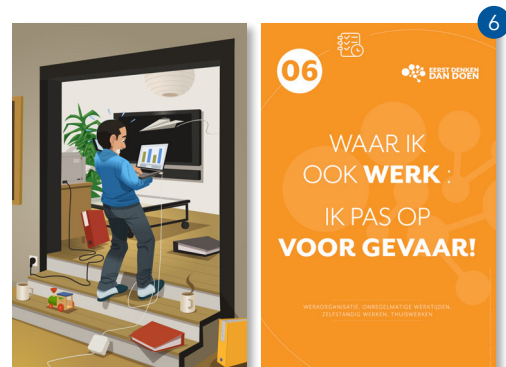
WERKORGANISATIE, ONREGELMATIGE WERKTIJDEN, ZELFSTANDIG WERKEN, THUISWERKEN