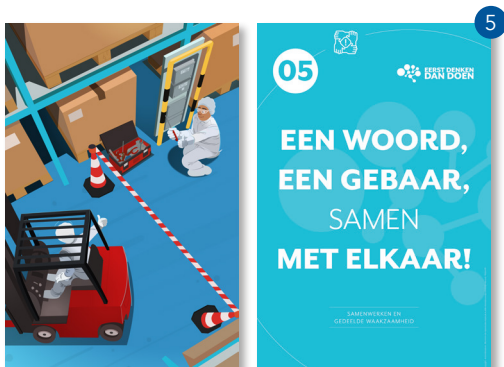
SAMENWERKEN EN GEDEELDE WAAKZAAMHEID