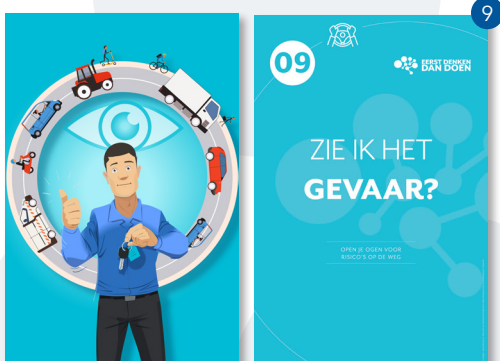
OPEN JE OGEN VOOR RISICO'S OP DE WEG