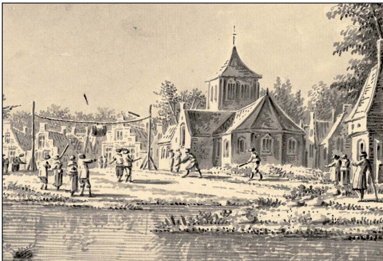
Afb. 4 Dorpskermis en katknuppelen in een gefingeerd dorp, ca 1780. Vervaardiger: Dirk Verriek.

Als iedereen klaar was om te beginnen, was de beurt eerst aan nummer 1. Net als