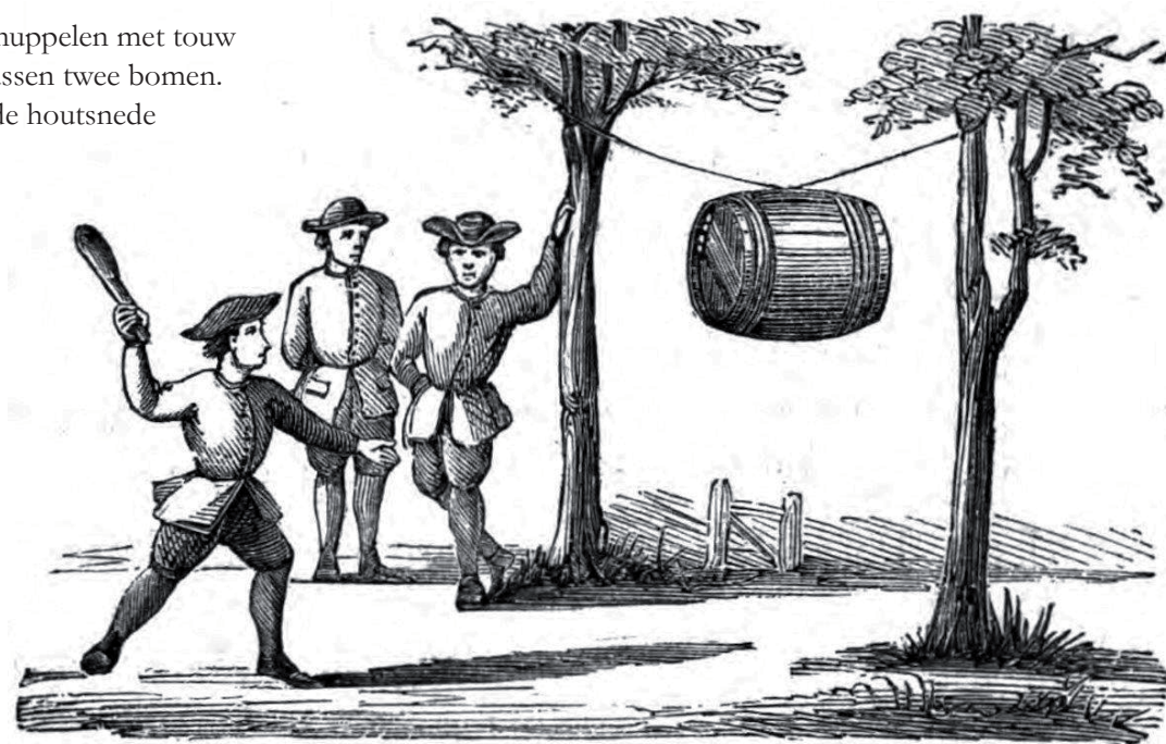
Afb. 5 Katknuppelen met touw gespannen tussen twee bomen. Naar een oude houtsnede