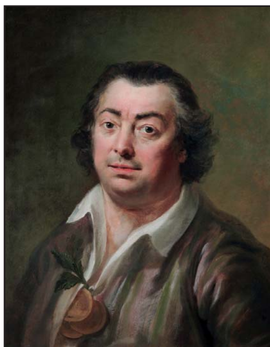
Afb. 3 Johannes le Francq van Berkhey (1729-1812) gaf in zijn Natuurlyke historie van Holland een gedetailleerde beschrijving van het katknuppelen. Portret toegeschreven aan Hendrik Pothoven.

De Nederlandse natuuronderzoeker, arts, dichter en schilder Johannes le Francq van Berkhey (Afb. 3) beschreef